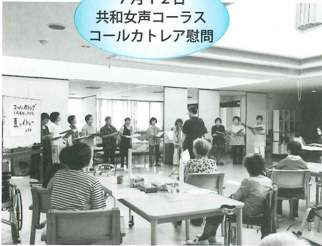
7月12日 共和女声コーラス コールカトリア慰問