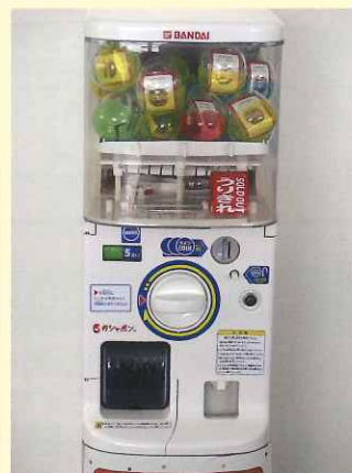
保健福祉センターに設置