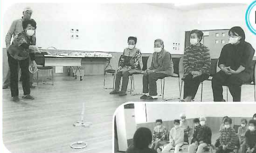
ゆうあい 国富友会クラブ

月に1度、情報共有、軽体操、レクリエーション等を通じて楽しい時間を過ごされています。