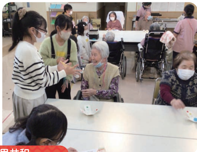
みのりの里共和 「東陽小学校4年生のみなさんと交流会」