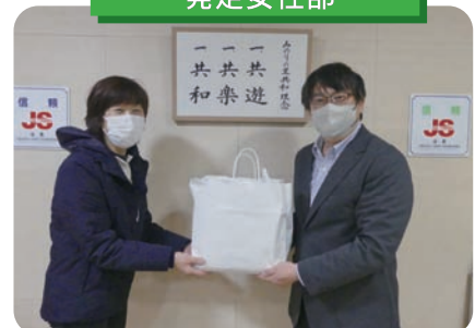
きょうわ農業協同組合 発足女性部