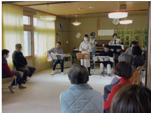
『ちゅらさん』による演奏