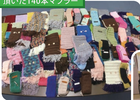
斉藤 正子様 頂いた140本マフラー