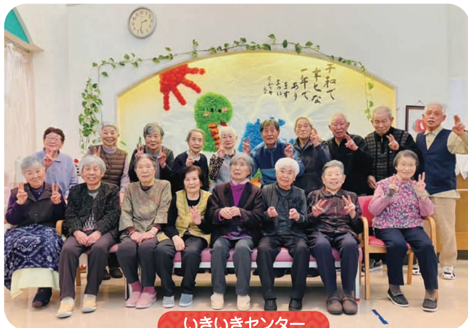
いきいきセンター 「巳年作品」