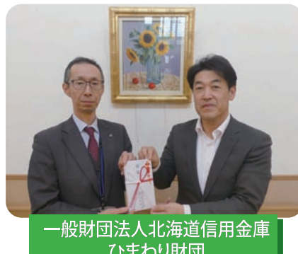
一般財団法人 北海道信用金庫 ひまわり財団